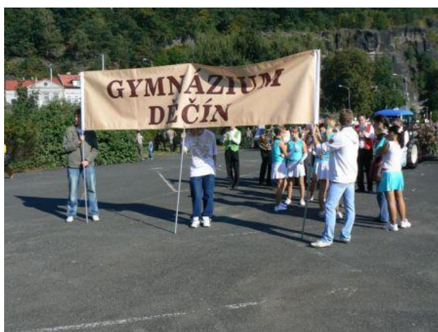
Několik záběrů z oslav 110. výročí založení školy