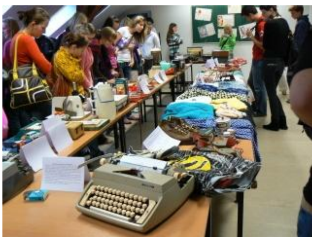
Výstavka „Občan za normalizace“ v rámci projektu „Projev zájem“